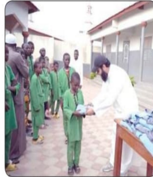
جانب من توزيع الكسوة على الأيتام