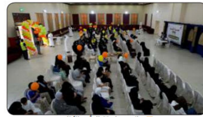
جانب من استقبال أسر الأيتام

وفي ختام تصريحه كرر رئيس جمعية الهداية الخيرية شكره وتقديره للأمانة العامة للأوقاف على دعمها للمشروع، وكذلك للمشروع، مؤكداً أن الجمعية مستمرة في تقديم كافة أشكال الدعم والعون والمساعدة للأيتام وعوائلهم، لرفع المعاناة عنهم وإعانتهم.