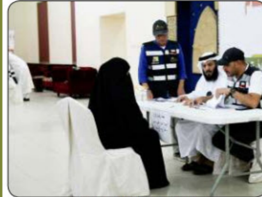
تدقيق الحالات قبل التسليم